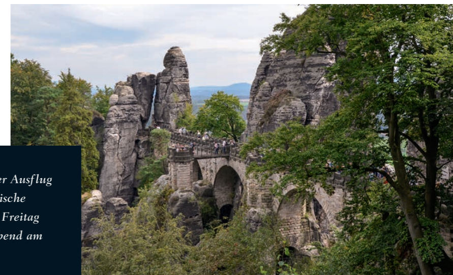
Gemeinsamer Ausflug in die Sächsische Schweiz am Freitag und Gala-Abend am Samstag