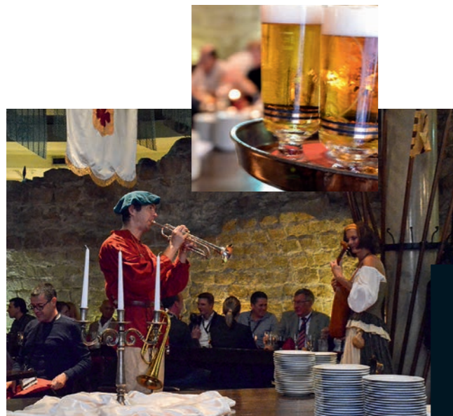
Bei Bier und deftigem Essen im Restaurant Pulverturm