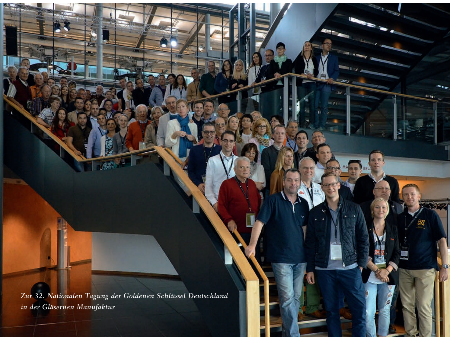
Zur 32. Nationalen Tagung der Goldenen Schlüssel Deutschland in der Gläsernen Manufaktur