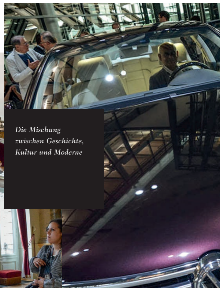
Die Mischung zwischen Geschichte, Kultur und Moderne