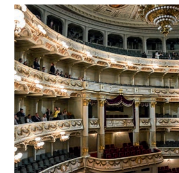
Als führendes Opernhaus Europas ist die Semperoper in Dresden Partner der Goldenen Schlüssel Deutschland