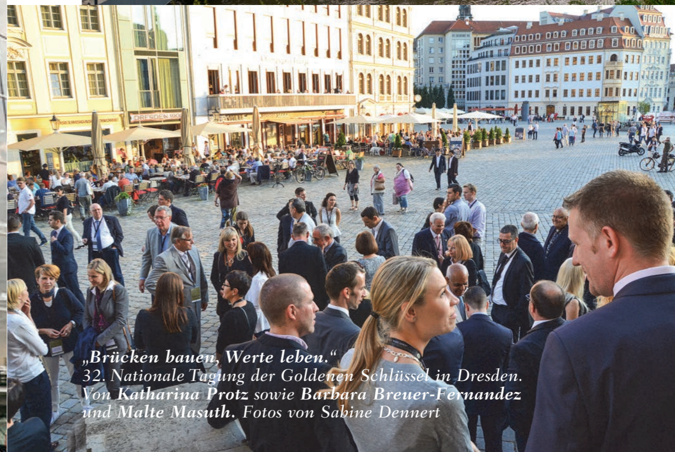
„Brücken bauen, Werte leben.“ 32. Nationale Tagung der Goldenen Schlüssel in Dresden. Von Katharina Protz sowie Barbara Breuer-Fernandez und Malte Masuth.

A m Donnerstag den 28. August wurde die 32. NATIONALE TAGUNG mit dem Meeting des Vorstandes und der Sektionsleiter sowie der Begrüßung der Pressevertreter im HOTEL BÜLOW PALAIS eröffnet. Für alle anderen Tagungsteilnehmer ging es nach der Anreise am Abend auf zur exklusiven